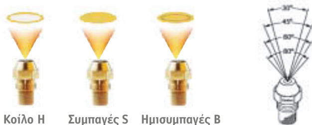
Κοίλο Η Συμπαγές S Ημισυμπαγές B

Η σειρά μπεκ OD συνδυάζει 3 τύπους (σχήμα ψεκασμού) και 4 γωνίες ψεκασμού, καλύπτοντας πλήρως όλες τις ανάγκες.